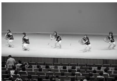
オープニング 四面楚歌による「花笠音頭」

も、多くの方のご出席いただき県内女性部員によるアトラクションを披露頂きながら、他県の女性部員との交流を図りました。県産