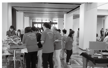
物産展コーナーの様子

酒の試飲コーナー や物産展も好評 で、商工会地区を アピールできた大会となり ました。