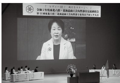
吉村県知事による動画メッセージ