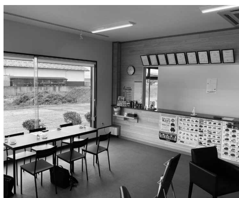
持続化補助金にてリニューアルした店舗内装

盛況な松山車輛であるが、事業を承継した当初は固定客の高齢化や地域の人口減少も影響し、業績は右肩下がりで事業の継続が困難な状況にあった。そんな中、今後の事業の方針について商工会へ相談した所、小規模事業者持続化補助金の活用を進められ、承継当初からの希望であった新規顧客の開拓を目的とした店舗内外装のリニューアルを行った。 「改装前の事務所は店舗前に販売車両を展示しておらず、初めての人が気軽に来店できるような雰囲気ではなかった。改装後は目玉車両の展示を行ったことでふらつと寄っていただけのお客さんも増え、新規顧客の獲得にもつながった。持続化補助金を活用して良かった点しかない