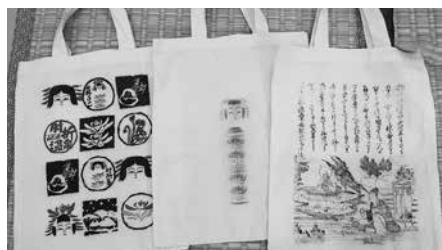
ガーメントプリンターにて印刷した作品