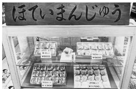
ほていや商店名物のほていまんじゅう