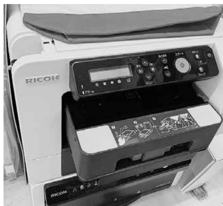
持続化補助金にて導入したガーメントプリンター