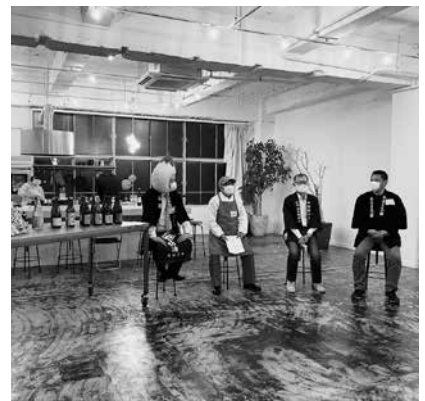
11月23日に開催したライブコマースの様子