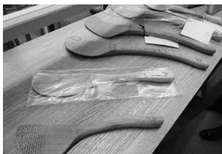
オリジナルブランド「kichi吉kichi」のターナー