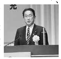
祝辞を述べる岸田総理

その祝辞の中で岸田総理からは「成長と分配の好循環による新しい資本主義の実現するため、まずは経済を成長させた上で、地域の経済や雇用を支える中小企業・小規模事業者の皆様に、成長の果実を享受していただけるよう、経済政策を進めていく」と力強く発信していただきました。