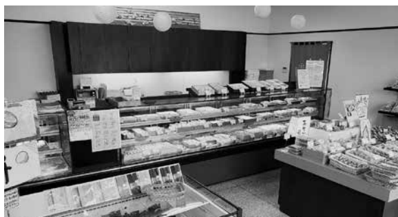
清潔感溢れる落ち着いた店内