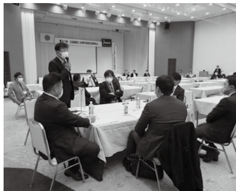
グループディスカッションの発表の様子 各グループで活発な意見交換が行われた

ロナ禍」においても事業継続していくことが、若き地域経済人でもある青年部員に求められていると感じる研修会となりました。