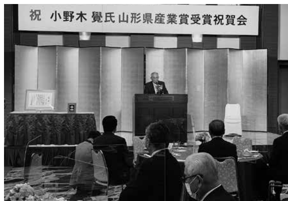
受賞の喜びと感謝を語る小野木会長