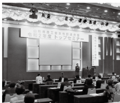
「地域の中での活動」の講演