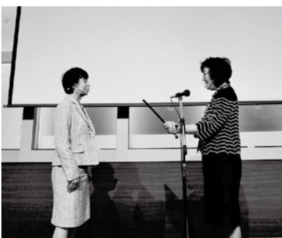
優良商工会女性部表彰【組織部門】 東根市商工会女性部 (令和元年度新規加入部員数7名)