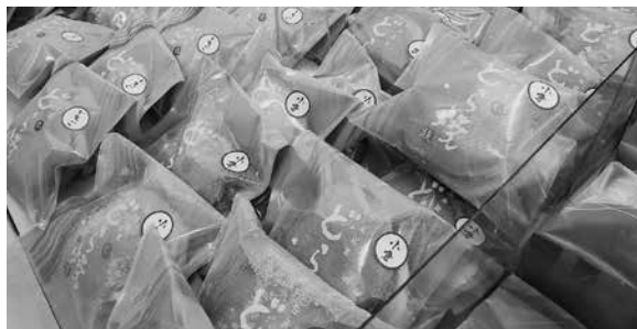
人気の生どらは種類も豊富