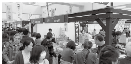
多くのお客様で賑わう山形県ブース