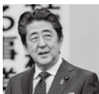
安倍晋三 内閣総理大臣