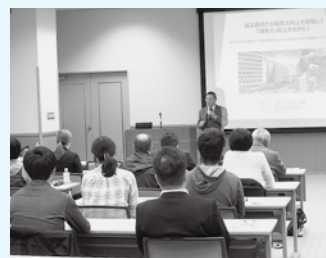
販売員向け販売力向上セミナー 11月5日開催