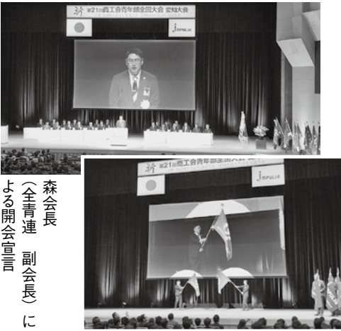
森会長 (全青連 副会長)に よる開会宣言

今後も持続的に企業経営を進展させ、地域経済人として努力していきたいと感じる有意義な大会でした。