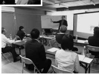
参加者からは、今後の事業計画を考えるきっかけになったとの声が聞かれました