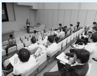
商品力・デザイン向上セミナー 10月11日開催