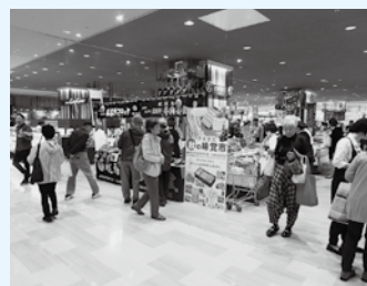
10月にイトーヨーカ堂武蔵境店で開催した「やまがた秋の味覚市」