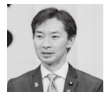
宮本周司 経済産業大臣政務官