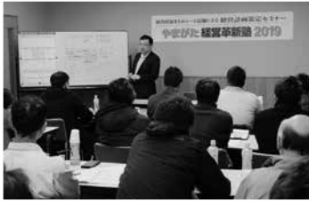
県内各地で人気の講師陣による経営革新塾を開催