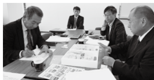
10月29日～31日に開催したセールスレップ事業 中間ミーティングの様子

10月に開催した「やまがた秋の味覚市」イトーヨーカ堂武蔵境店でのアンケート調査実施