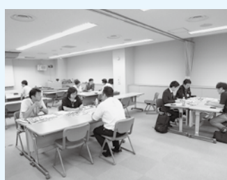
東武百貨店池袋店バイヤーとの 個別相談会 9月