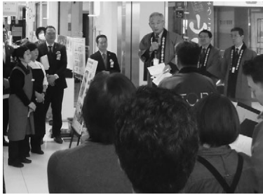
オープニングの様子