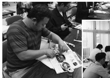
県内各地で人気の講師陣による経営革新塾を開催