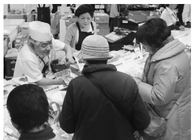
どのブースも、大いに賑わいました