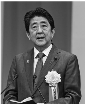
安倍総理他多くのご来賓に、ご臨席いただきました