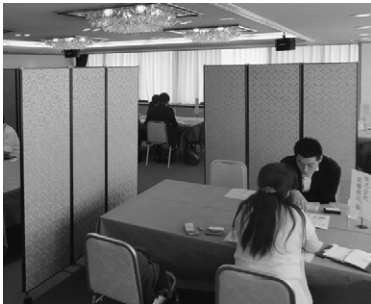
県内の6事業所が参加し、6名のバイヤーと商談を行いました。

9月27日に東京都内の会場にて、バイヤーと直接商談を行う同行商談事業を開催しました。商談では、バイヤーからの商品開発や改善に繋がる貴重なアドバイスを頂くとともに、事業者からは「今後の商談にもつながる」といったご意見をいただきました。