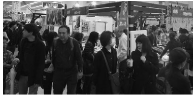
多くのお客さまで賑わう山形県ブース