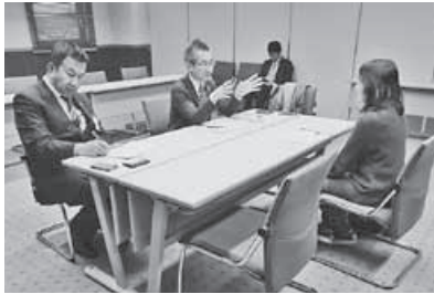
出展者説明会、事後報告会での個別相談会では、百貨店バイヤーからのアドバイスを頂いた