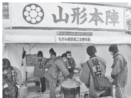
山形本陣（もがみ南部商工会青年部）