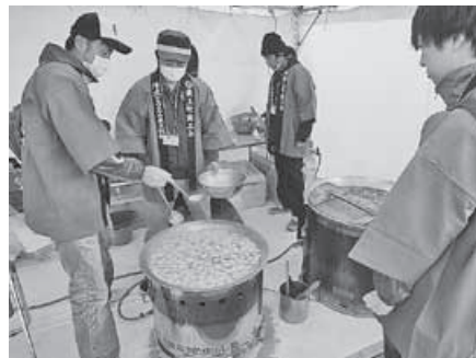
芋煮の陣 in 全国大会