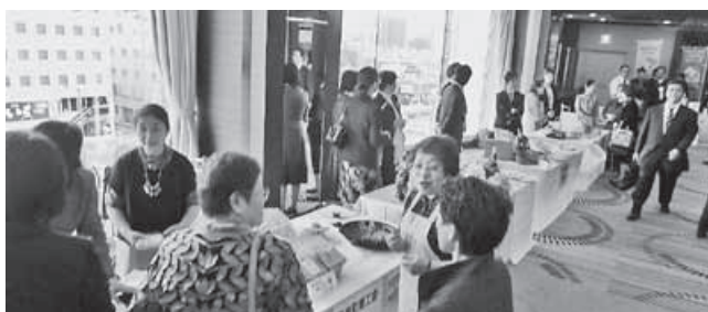
青年部・女性部事業成果品出展