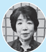
西川町商工会女性部