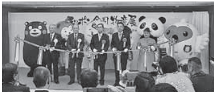
オープニングセレモニーでは、全国各地のゆるキャラが集まった