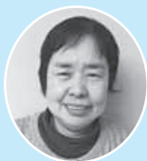
東根市商工会女性部