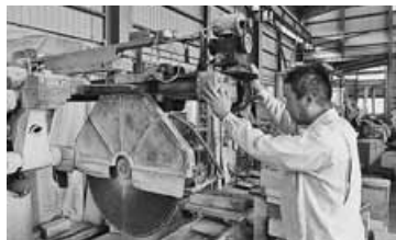
事務所に隣接する工場には、加工段階に応じた様々な加工機械が並び