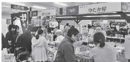
多くのお客さまで賑わう山形県ブース