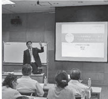
県内各地で人気の講師陣による経営革新塾を開催