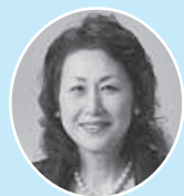
上山市商工会女性部