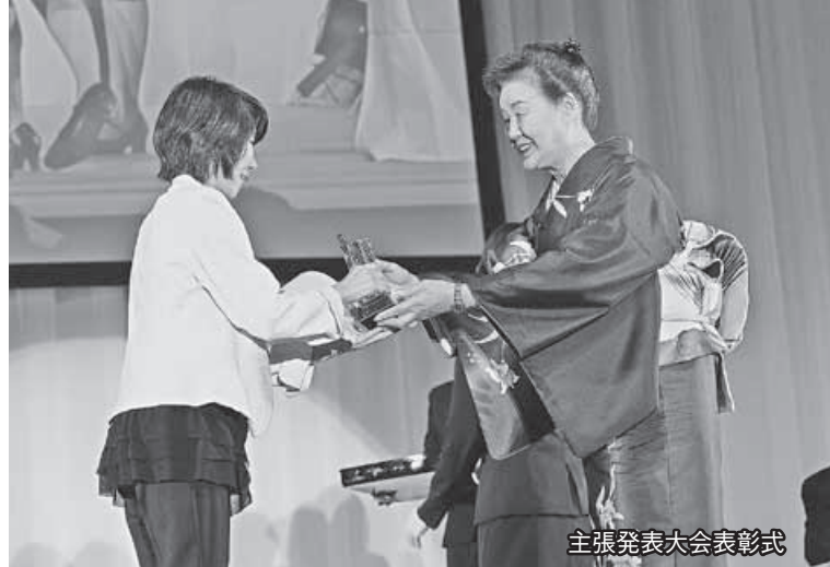
主張発表大会表彰式