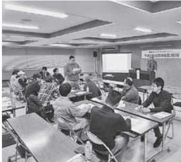
参加者からは、今後の事業計画を考えるきっかけになったとの声が聞かれた