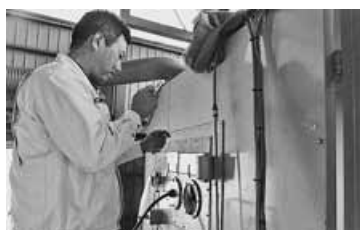
高圧で砂を吹き付けることで彫刻を行うサンドブラスト。ペン状になっており、細やかな作業が求められる

の細やかなオーダーに答えられるよう、石材加工から文字の彫刻までを一貫して行える設備を持っています。また、完成後のイメージを立体的に掴んでもらえるよう、3D図面も早期に導入しました。以前からも平面図面等でデザイン等を確認してもらっていましたが、3D化により、さらにお客さんのニーズに合ったサービスを提供できるようになったと感じています。