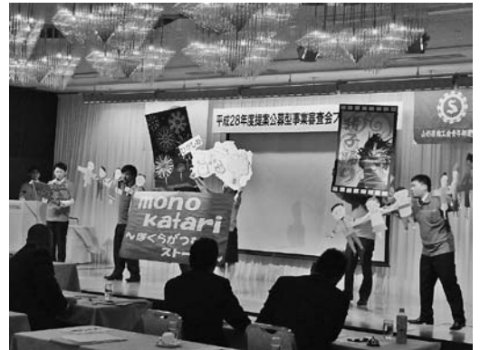
提案公募型事業審査会 2位 東根市商工会青年部の発表