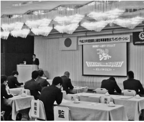
提案公募型事業審査会 1位 寒河江市商工会青年部の発表

1位に選ばれたのは、寒河江市商工会青年部で、仮想通貨などゲームの要素を取り入れた職業体験を通じて、子供たちに楽しみながら仕事の大切さを学んでもらおうという新感覚のゲーム型ワークショップイベント「コードモモシゴト」ボクノマチクエスト」を提案しました。2位は