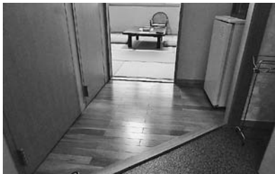
段差を少なくし、どなたでも安心して宿泊できる4階の客室