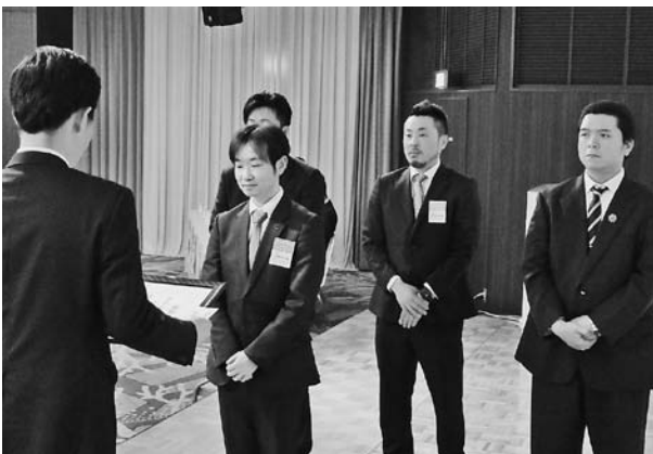
平成27年度優良商工会青年部表彰 並びに部員増強コンテスト表彰式