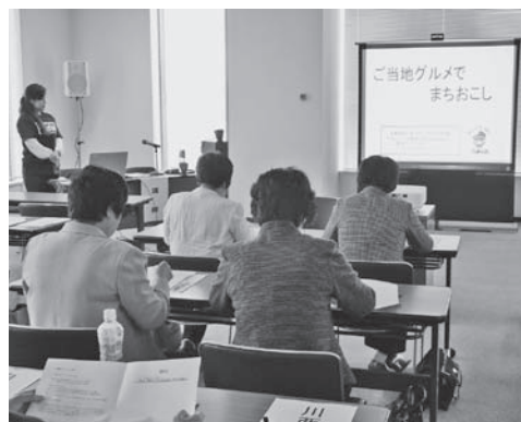
「ご当地グルメでまちおこし」講演会