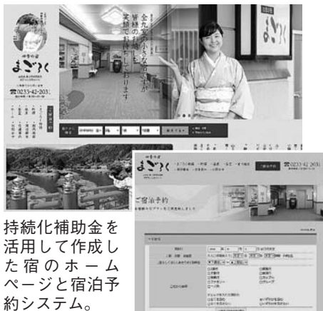
持続化補助金を活用して作成した宿のホームページと宿泊予約システム。

想以上に大きな反響があり、あの時一步を踏み出せて本当に良かったと思います。 地元のお客さま、遠方から楽しみにしていらつしやるお客さまに満足して宿泊していただけるよう、設備は都会型で新しく、でも中身は素朴な人情味あふれるおもてなしをこれからも目指して頑張っていきます。