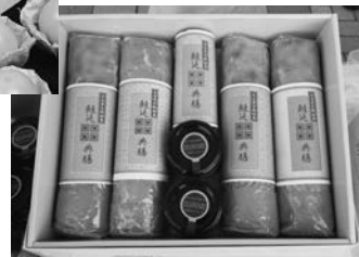
大玉の「食用ほおずき」と鮭延典膳をイメージしたロールケーキのセット

食・アンケートを行い、多くの方から美味しい、興味があるなど、多数の好評なご意見もいただきました。現在、「食用ほおずき」を活用した商品の多角的な販売について確かな手ごたえを感じながら、一層の検討を進めているところです。