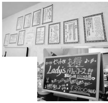
豊富なメニューはお客様の興味をひきます。