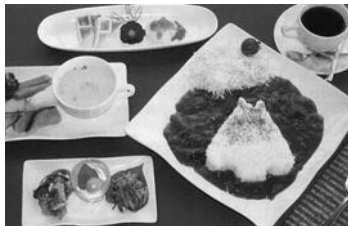
鮭川村の名所であるトトロの木をモチーフにしたこのカレーを試作販売（平成22年度実施）

各町村には支部が置かれ各々独自の事業を展開しています。うち鮭川村では、行政、商工会、JA、羽根沢温泉旅館組合のほか、特産品開発に取り組む商工会青年部OBによる有限責任事業組合（略称LLP）フリーハンドなどの団体が一体となり、「鮭川村地域資源戦略会議」を設立し定期的に会議を開催するなどして地域活性化の諸課題に積極的に取り組んでいます。当商工会では、平成22年度に採択された全国展開プロジェクトの調査事業をはじめ、様々な地域課題の解決に取り組んでいます。