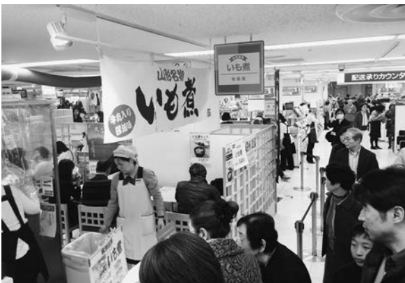
多くのお客さんと販った「いいもの発見 やまがた物産展」

さまざまな催事に出展しています。今回の「いいもの発見 やまがた物産展」は出展のハードルも低く、開催場所も東武百貨店池袋店ということで集客力が見込める立地でしたので、ご案内を頂いてすぐ参加の申し込みをしました。今回の出展では、いも煮の実演販