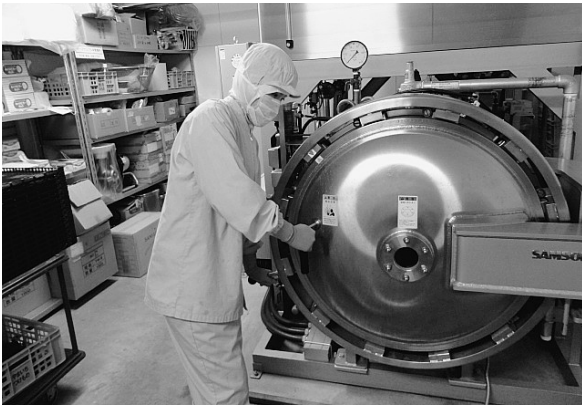
レトルト食品を製造する加圧殺菌装置（レトルト釜）。1回の稼働でさくらんぼカレーが約380袋調理できる

ブの栽培と販売、そして収穫された野菜を提供する飲食店を運営しております。淡い桃色のさくらんぼカレーは、秘密のケンミンSHOWで紹介されたこともあり、ご存じの方もいらっしゃるのではないでしょう