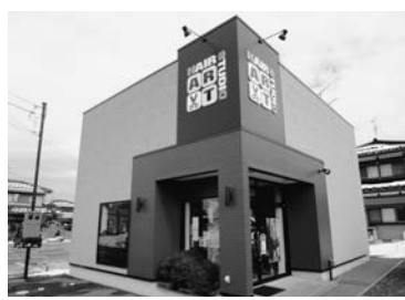
持続化補助金採択により改装された外観。明るい雰囲気のお店です。

手始めとして行ったのが持続化補助金を活用した店舗改装です。外装工事により店舗が明るい雰囲気になりました。また、女性メニュー提供の看板を設置することで通りすがりの方にも目につき、視覚的に訴えるようにしました。