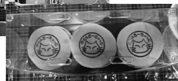
童話「絵に描いた猫」をモチーフにした生どら焼き。試食後のアンケートは今後の商品開発にとって貴重な意見となりました