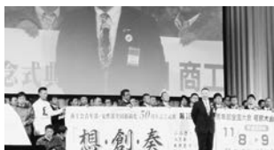
次回開催地は福島県郡山市にて

今後、今後も持続的に企業経営を進展させ、地域経済人として努力していきたいと感じる大会でした。