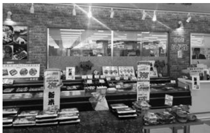
LEDを導入した明るい店内