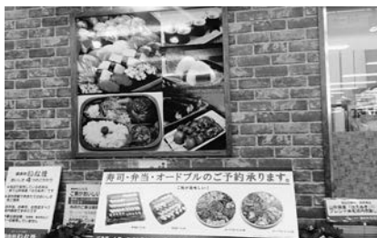
力をいれているディスプレイ

「銀舍利いなほ」というお店の名前の通りお米にも強いこだわりがあります。元々は米飯のみを扱っていたこともあり、1日に30kgものお米