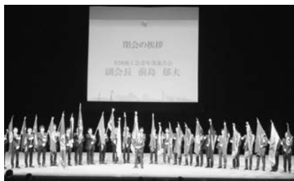
全国大会フィナーレ