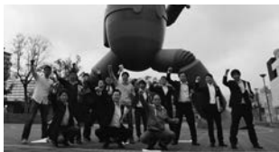
「新長田駅の震災からの復興と町おこし」について研修