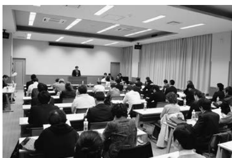
事後報告会では、展示販売会を総括し、今後の販路開拓策について学びました。