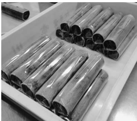
素材にこだわり丁寧に作り上げた銘菓「三平撰」

昨年の持続化補助金では、「お菓子屋さんの提供するふわふわかき氷」というテーマで、かき氷機の導入とかき氷の独自シロップの開発、店舗の看板設置を行いました。かき氷シロップも松月堂布川ならではのオリジナルシロップを作るた